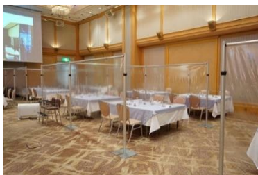
テーブルごとに仕切りを設けたセッティングイメージ