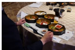
一度にご提供する五段重