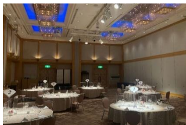
参加人数に合わせた広めの会場のご案内

ソーシャルディスタンスに伴い、ゆとりをもった会場レイアウトをご提案。テーブルにはアクリルパネルを設置し、1卓の人数を8名⇒4～5名程に減らしてご準備するほか、ご宴会の開催時に気になる“参加人数の不安”を解消するため4～5名様ごとに飛沫防止シートで仕切りをつくり会場内にプライベート空間のような設えをご準備することも可能です。