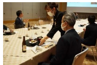
お膳ごとに3回に分けて配膳